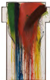
ARNULF RAINER Kreuz (Cross) , 1987-88 Schätzwert: € 80.000–120.000 Ergebnis: € 226.800 © ARNULF RAINER