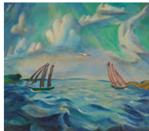
ERICH HECKEL Segelschiffe (Auf der Flensburger Förde) ( Sailing Ships (On the Flensburg Fjord) ), 1922 Schätzwert: € 200.000–300.000 Ergebnis: € 252.000 © NACHLASS ERICH HECKEL, HEMMENHOFEN