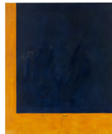
GÜNTHER FÖRG Ohne Titel (Untitled) , 1991 Schätzwert: € 100.000–150.000 Ergebnis: € 189.000 © VG BILD-KUNST, BONN 2023