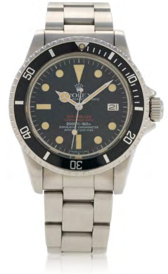
ROLEX 'Double Red' Sea-Dweller, Ref. 1665 Edeldahlarmbanduhr mit Datum und Armband, um 1977 Schätzwert: € 26.000–50.000 / Ergebnis: € 35.280