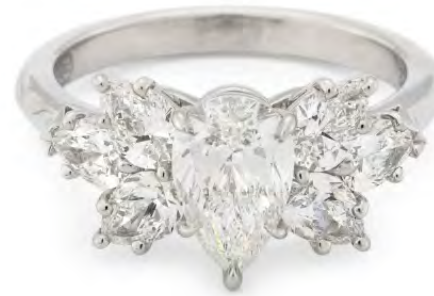
HARRY WINSTON Diamantring Schätzwert: € 4.000–7.000 / Ergebnis: € 12.600