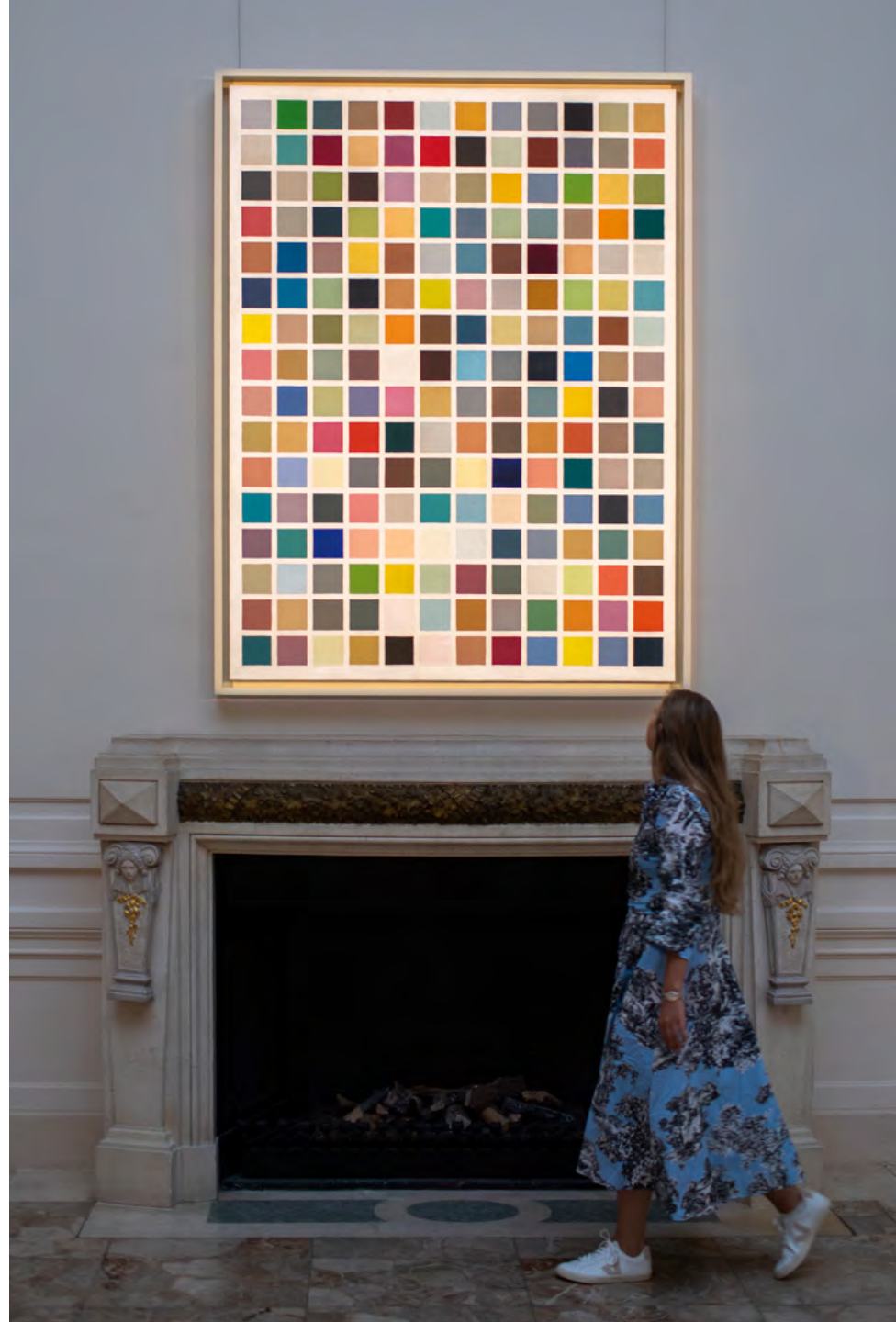
GERHARD RICHTER 192 Farben, 1966