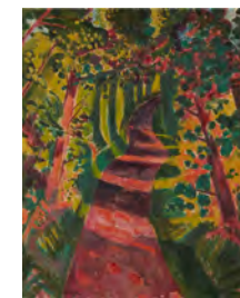
MAX PECHSTEIN Herbstschatten ( Autumn shade ), 1921 Schätzwert: € 120.000–180.000 Ergebnis: € 239.400