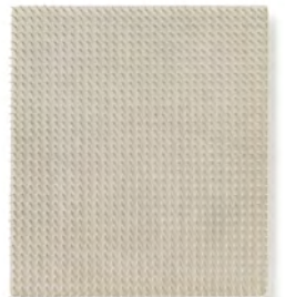
GÜNTHER UECKER Reihung (Alignment) , 1962 Schätzwert: € 120.000–180.000 Ergebnis: € 302.400 © VG BILD-KUNST, BONN 2023