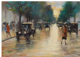
LESSER URY Tiergartenstraße, Berlin Schätzwert: € 70.000–100.000 Ergebnis: € 189.000